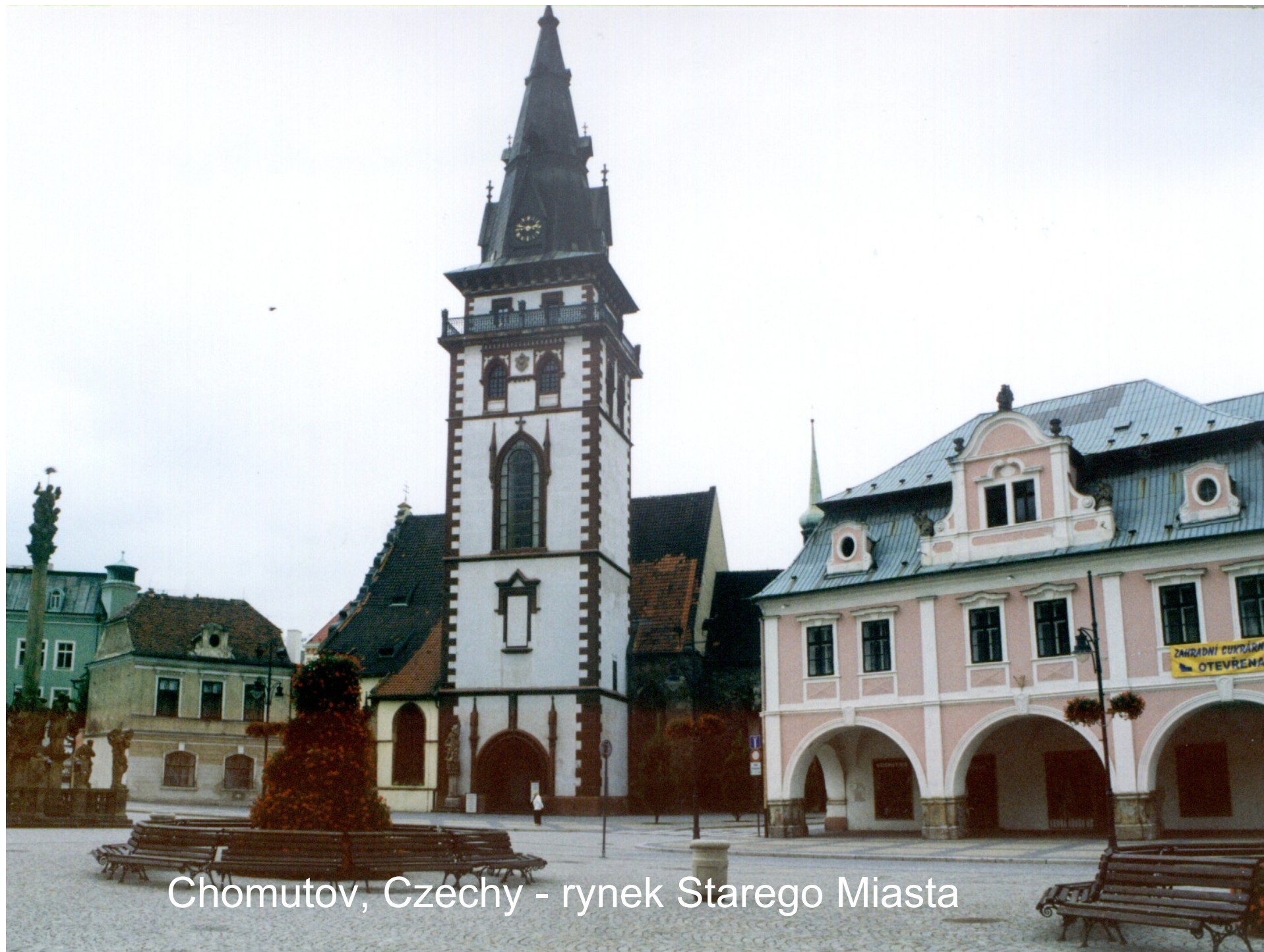
Chomutov, Czechy - rynek Starego Miasta