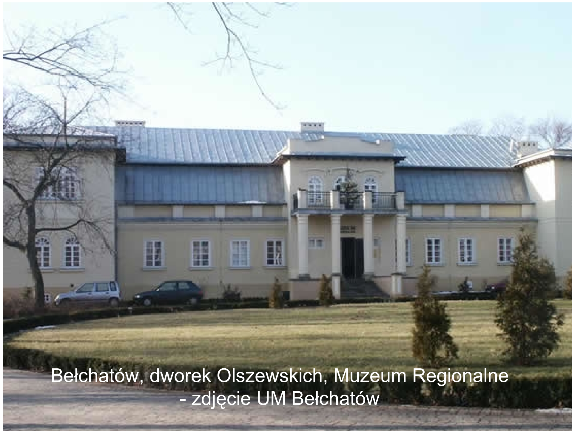
Bełchatów, dworek Olszewskich, Muzeum Regionalne - zdjęcie UM Bełchatów