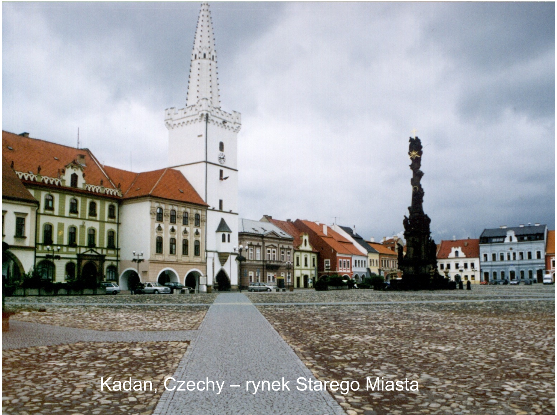
Kadan, Czechy – rynek Starego Miasta