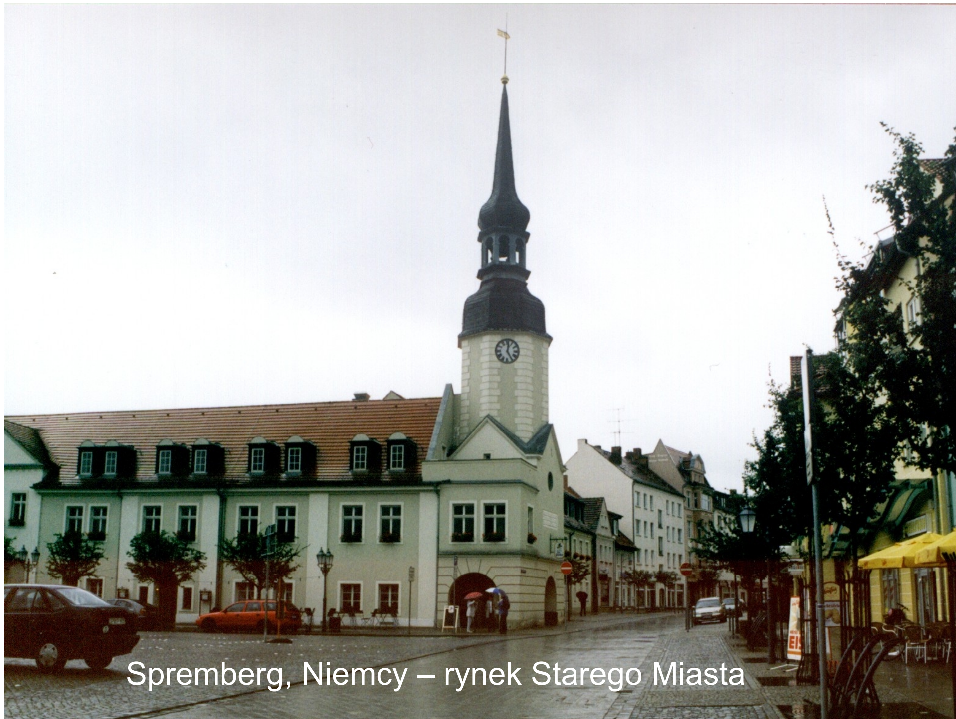
Spremberg, Niemcy – rynek Starego Miasta