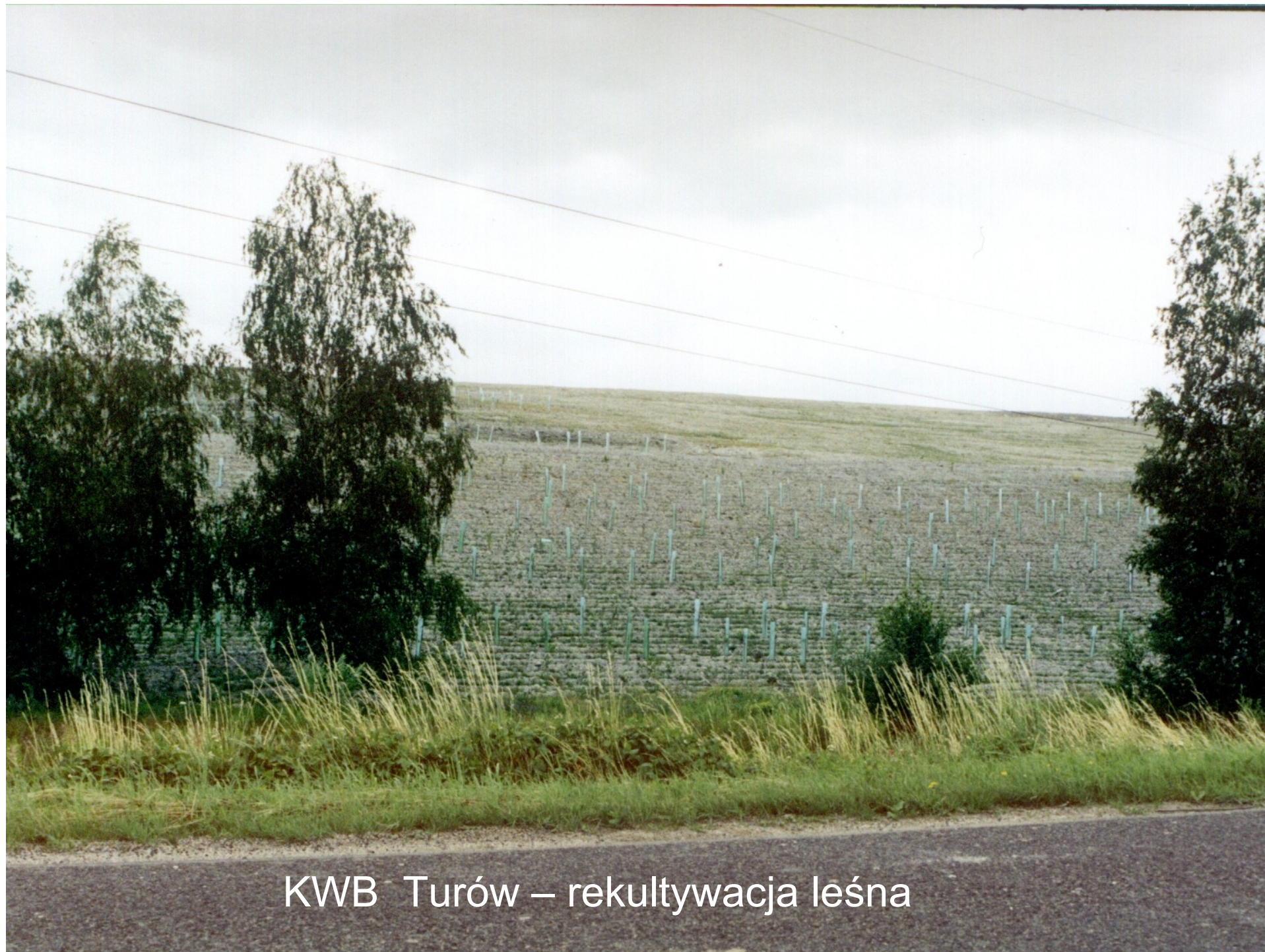
KWB Turów – rekultywacja leśna