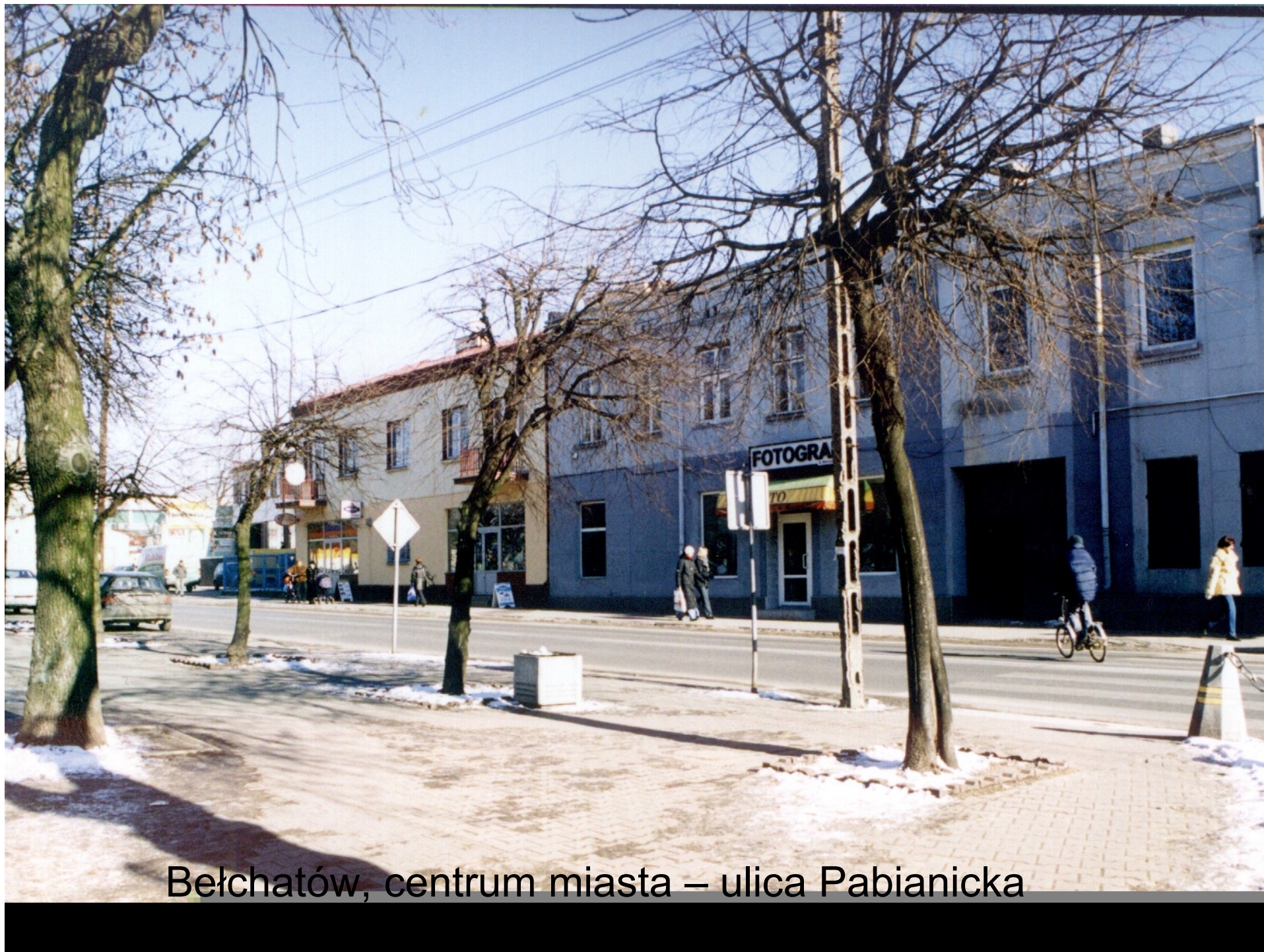
Bełchatów, centrum miasta – ulica Pabianicka