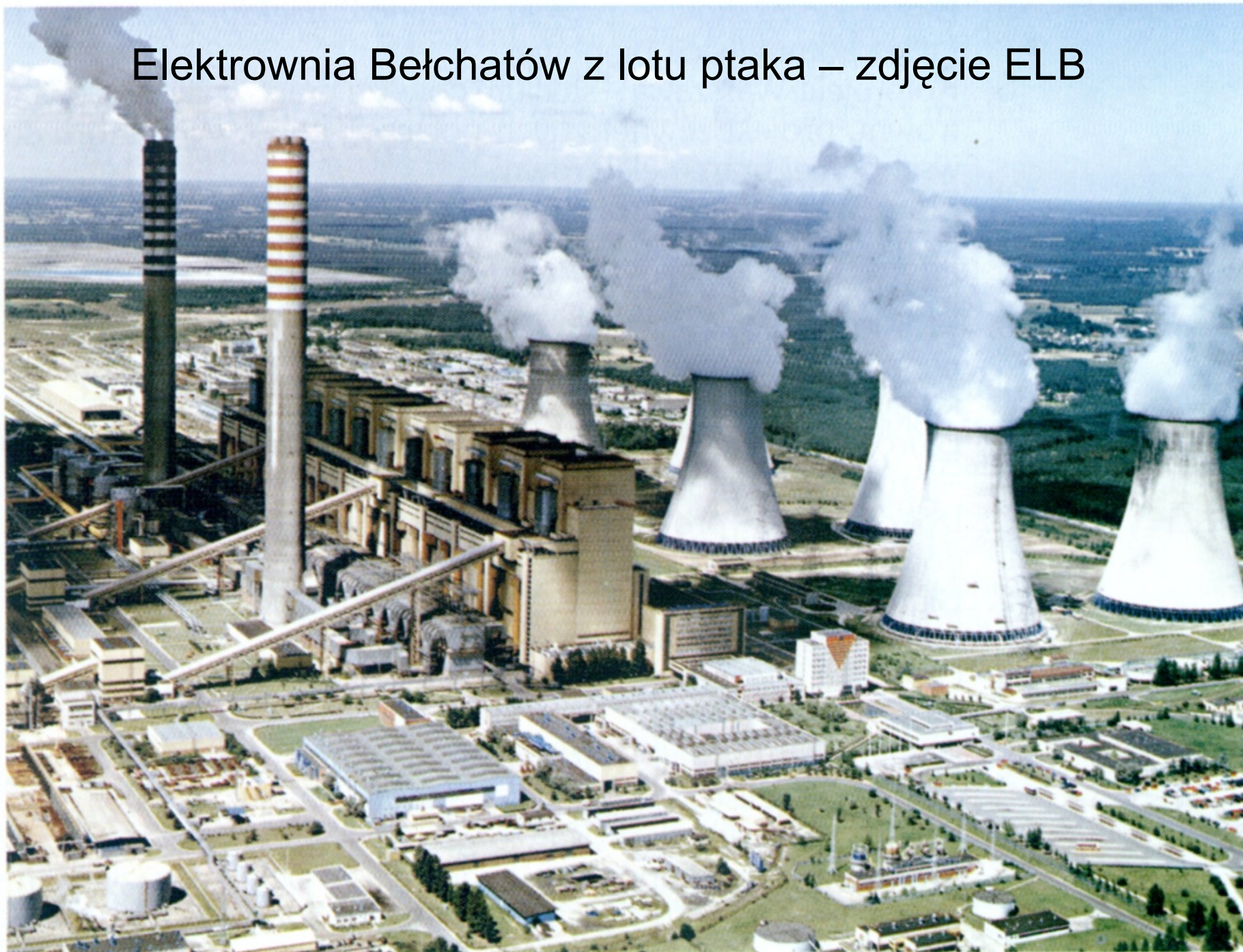
Elektrownia Bełchatów z lotu ptaka