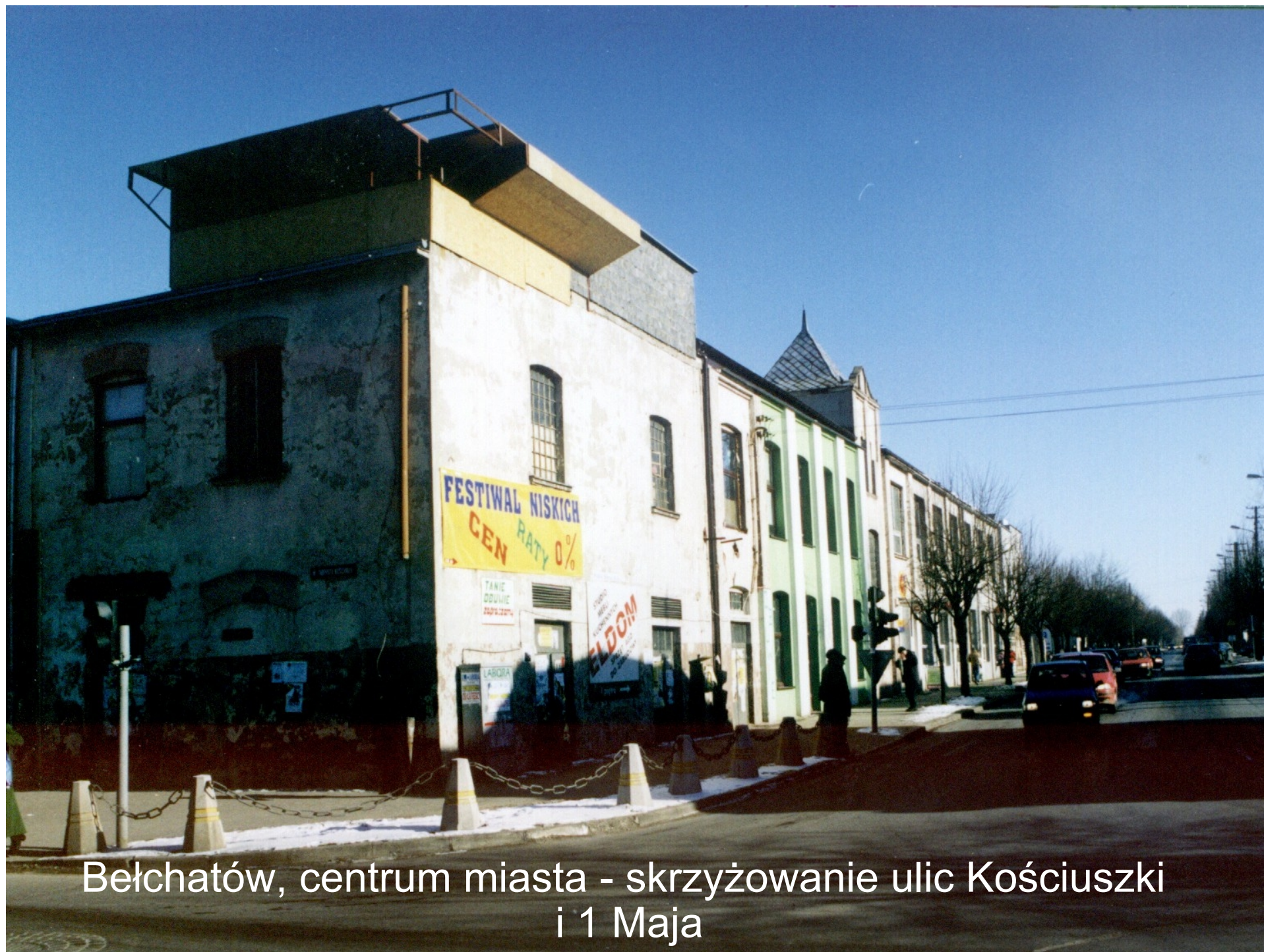
Bełchatów, centrum miasta - skrzyżowanie ulic Kościuszki i 1 Maja