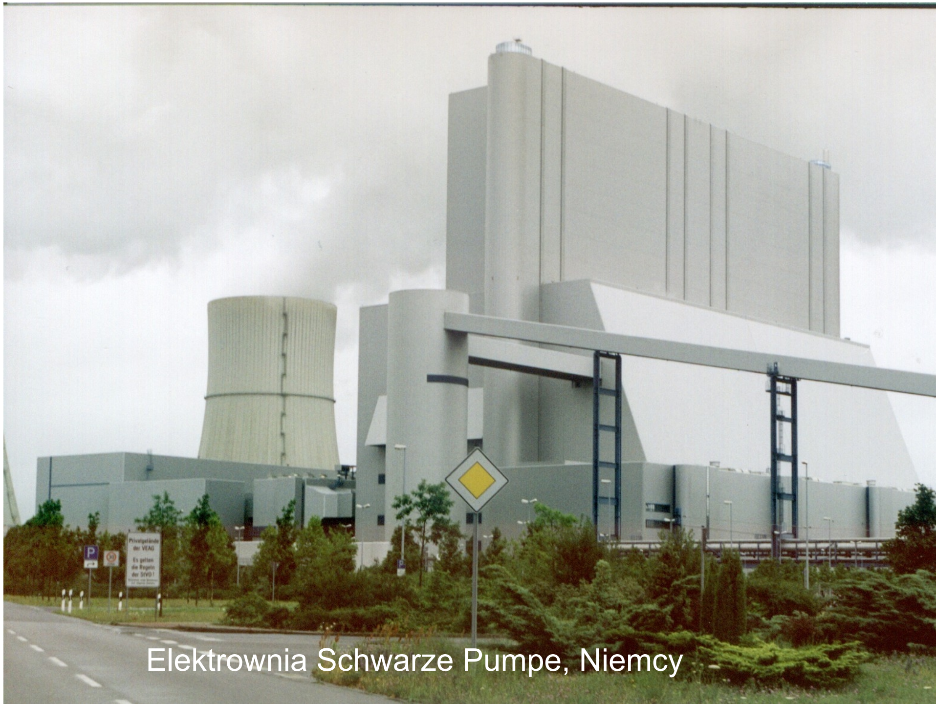
Elektrownia Schwarze Pumpe, Niemcy