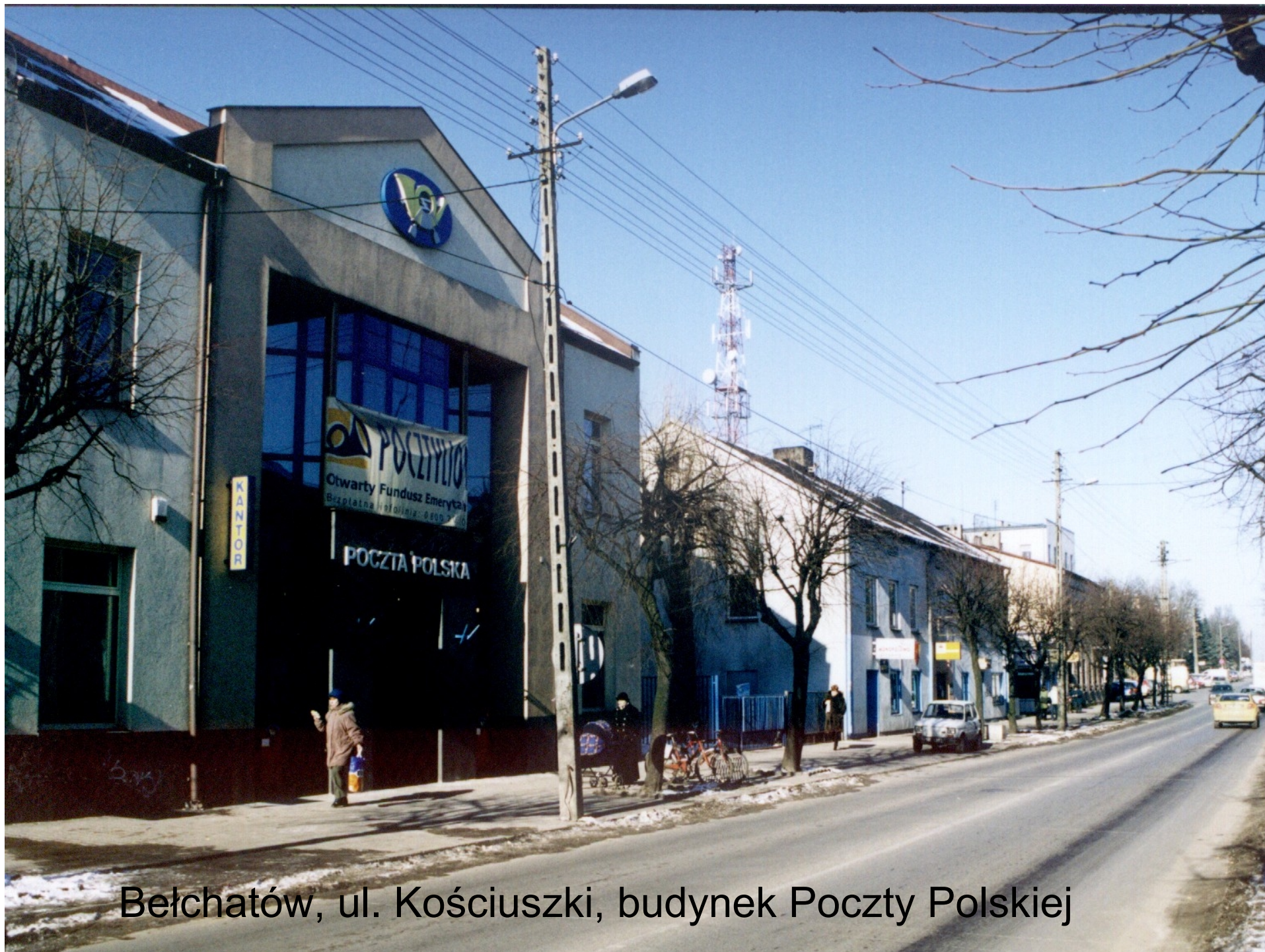
Bełchatów, ul. Kościuszki, budynek Poczty Polskiej