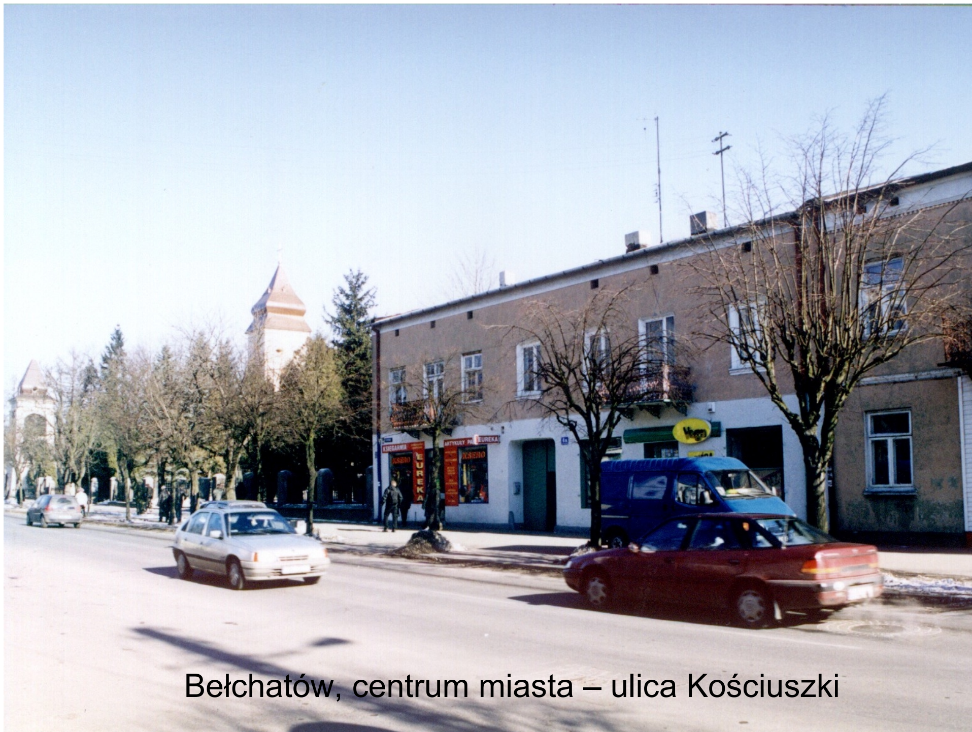
Bełchatów, centrum miasta – ulica Kościuszki