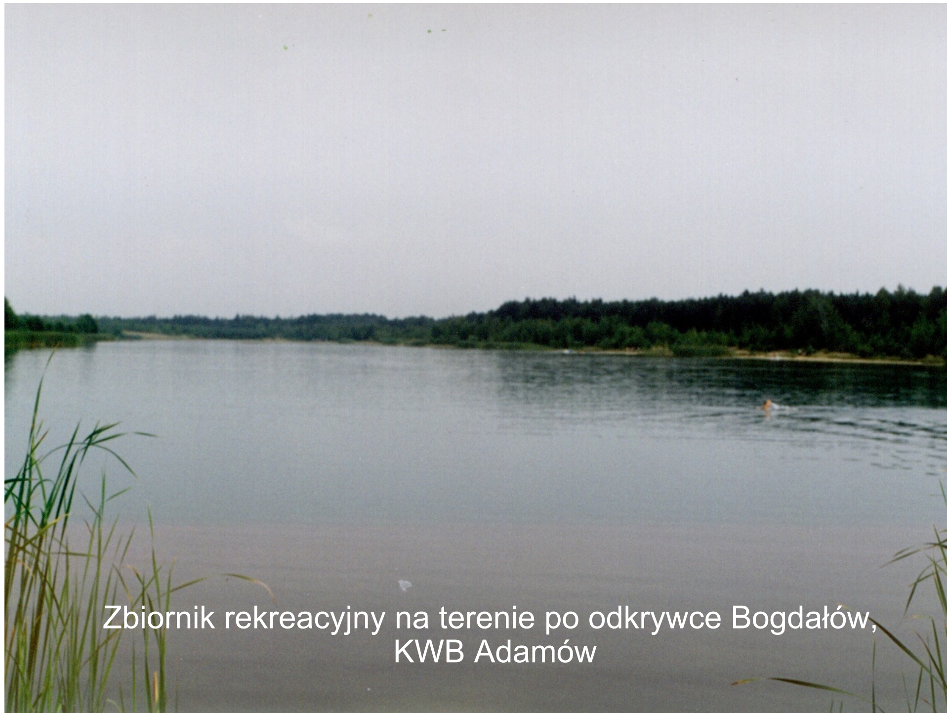
Zbiornik rekreacyjny na terenie po odkrywce Bogdałów, KWB Adamów