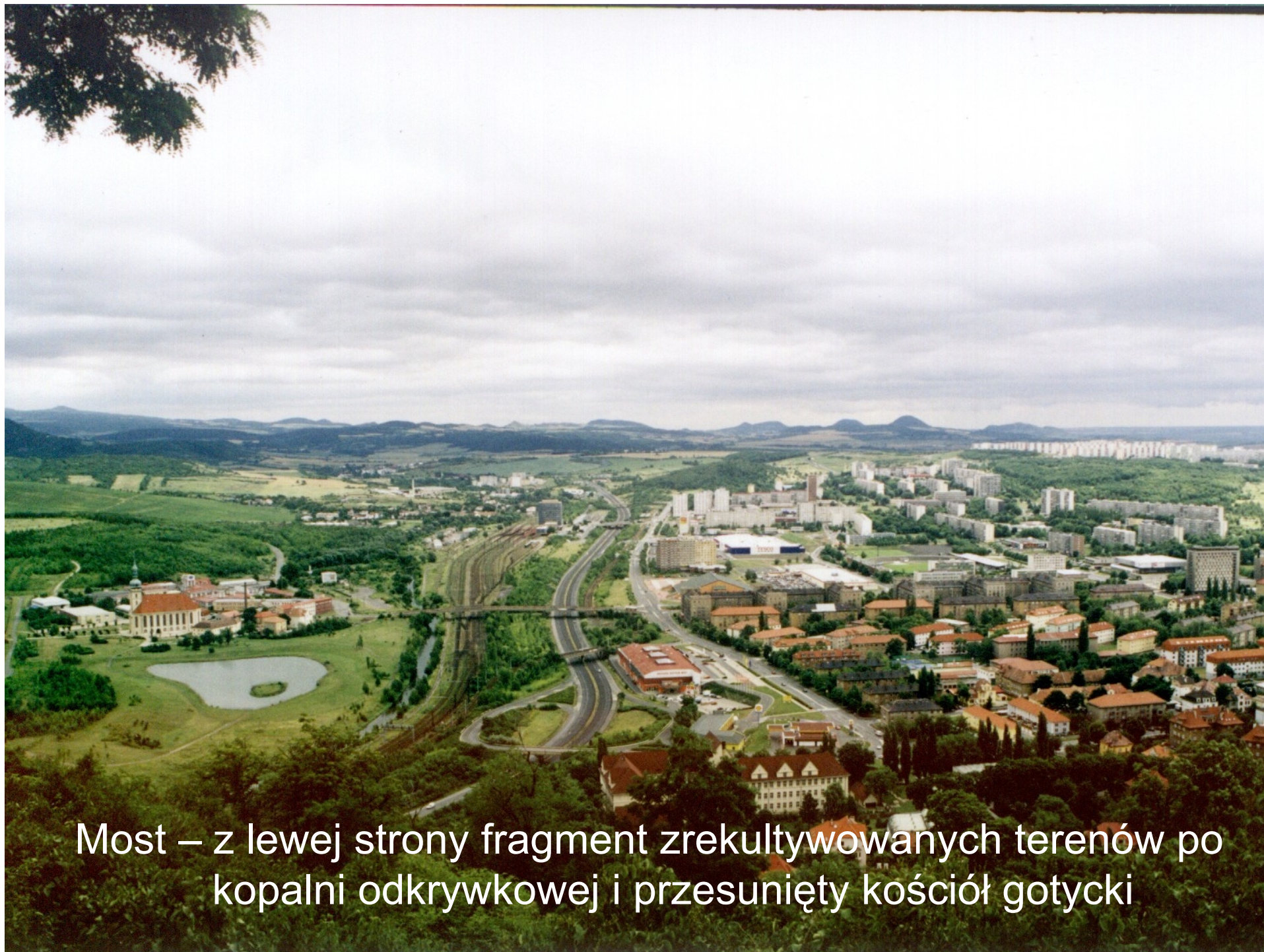
Most – z lewej strony fragment zrehabilitowanych terenów po kopalni odkrywkowej i przesunięty kościół gotycki