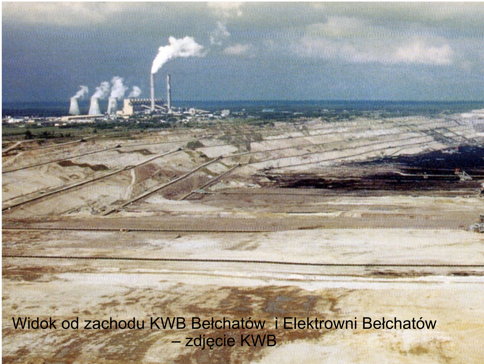
Widok od zachodu KWB Bełchatów i Elektrowni Bełchatów