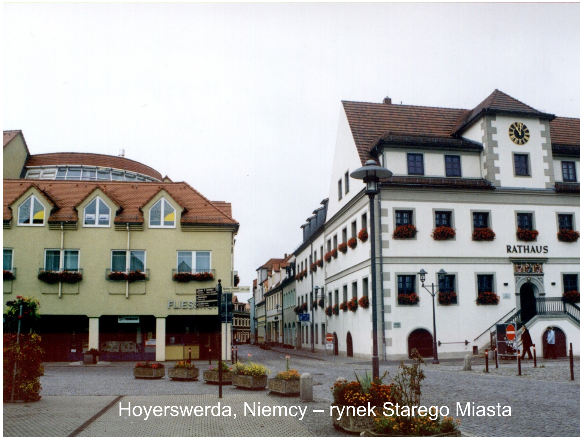
Hoyerswerda, Niemcy – rynek Starego Miasta