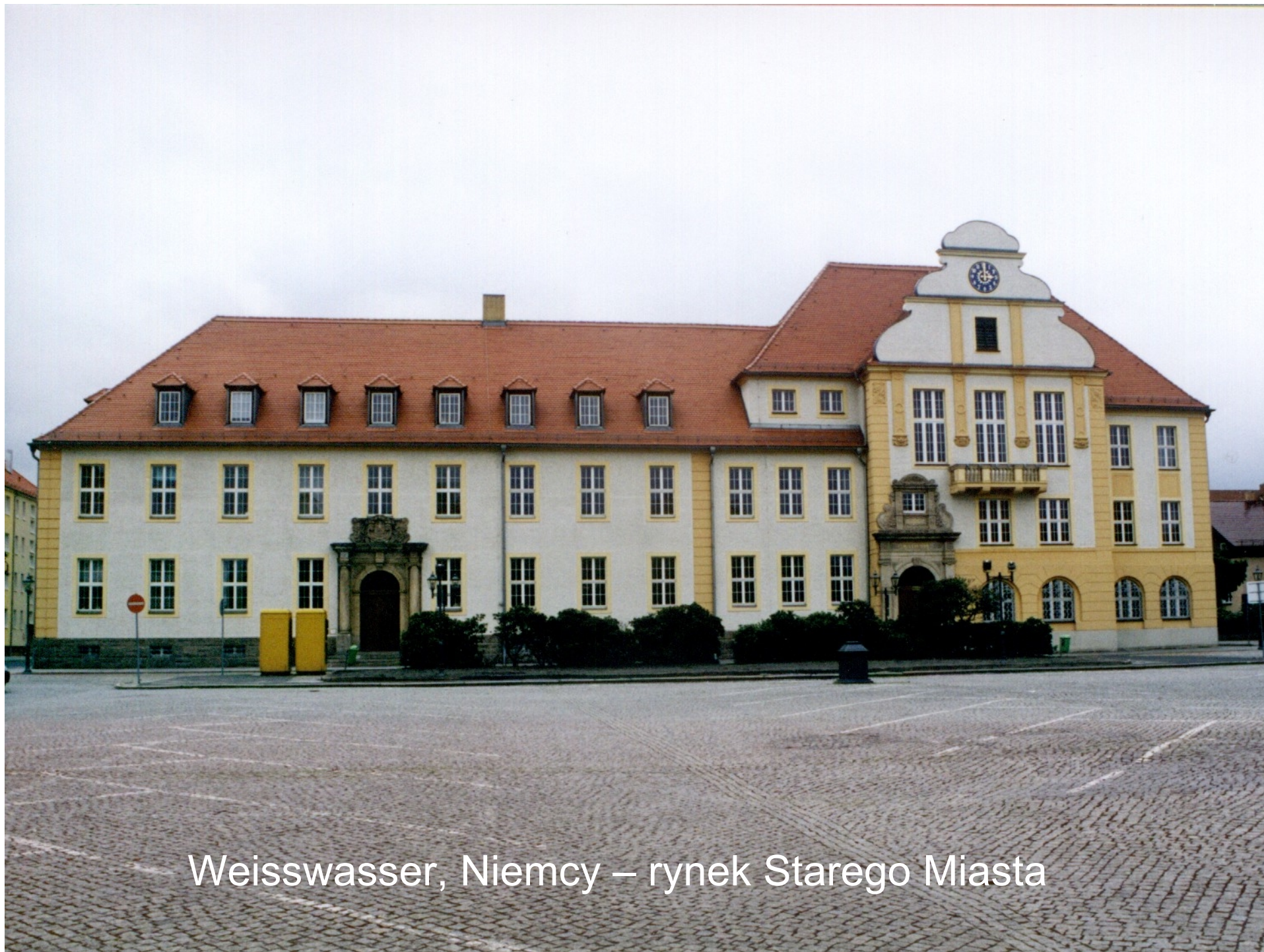
Weisswasser, Niemcy – rynek Starego Miasta