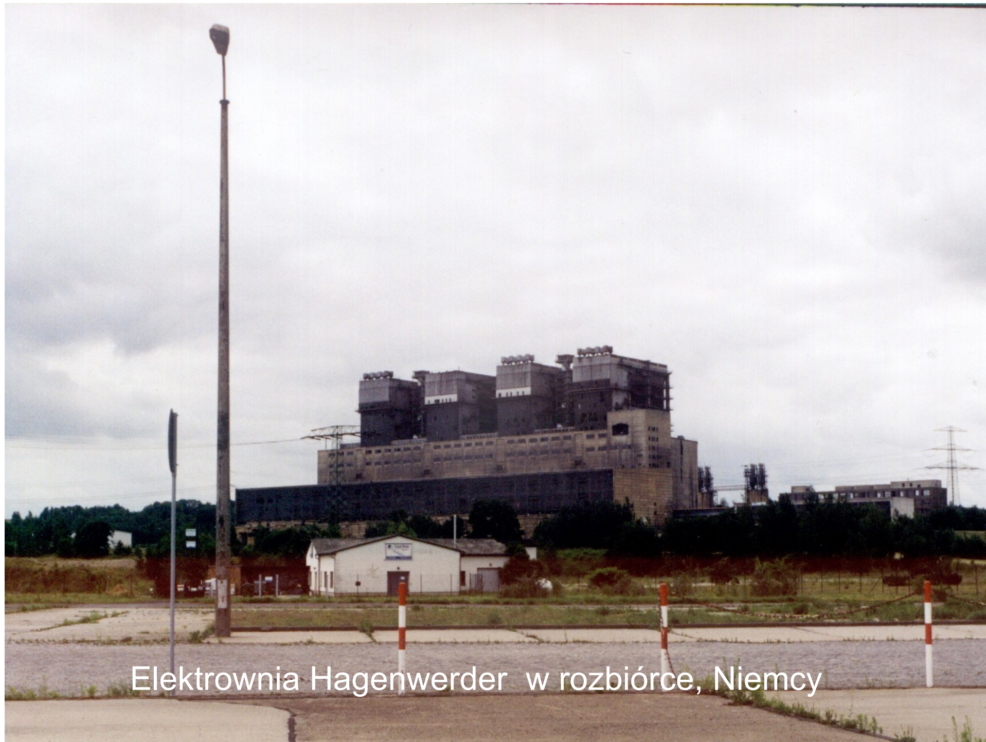
Elektrownia Hagenwerder w rozbiórce, Niemcy