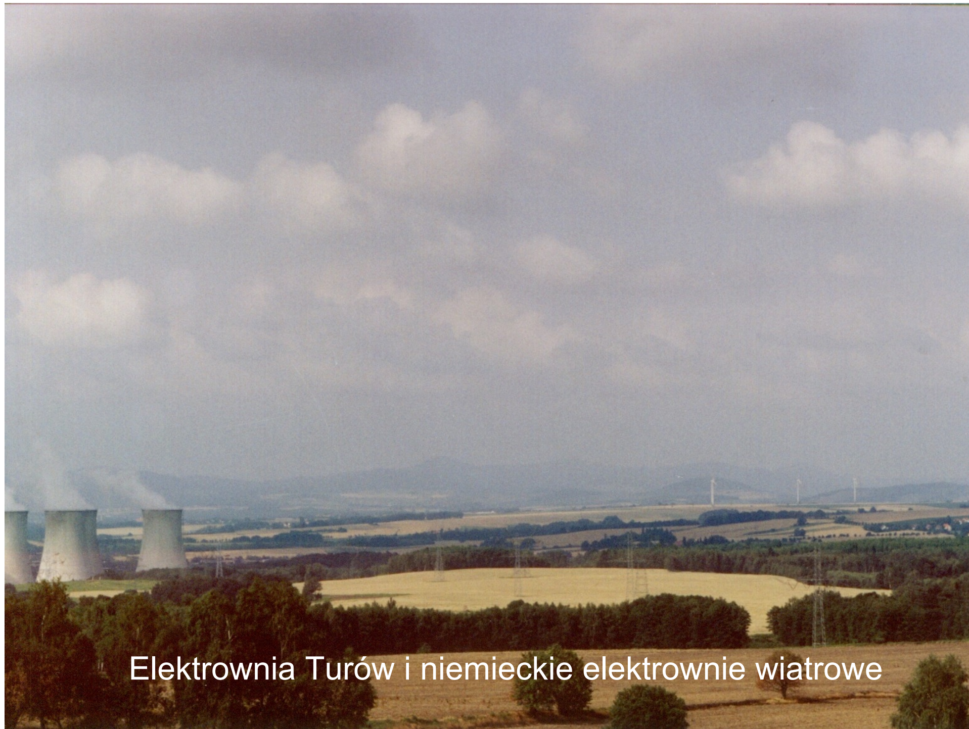
Elektrownia Turów i niemieckie elektrownie wiatrowe