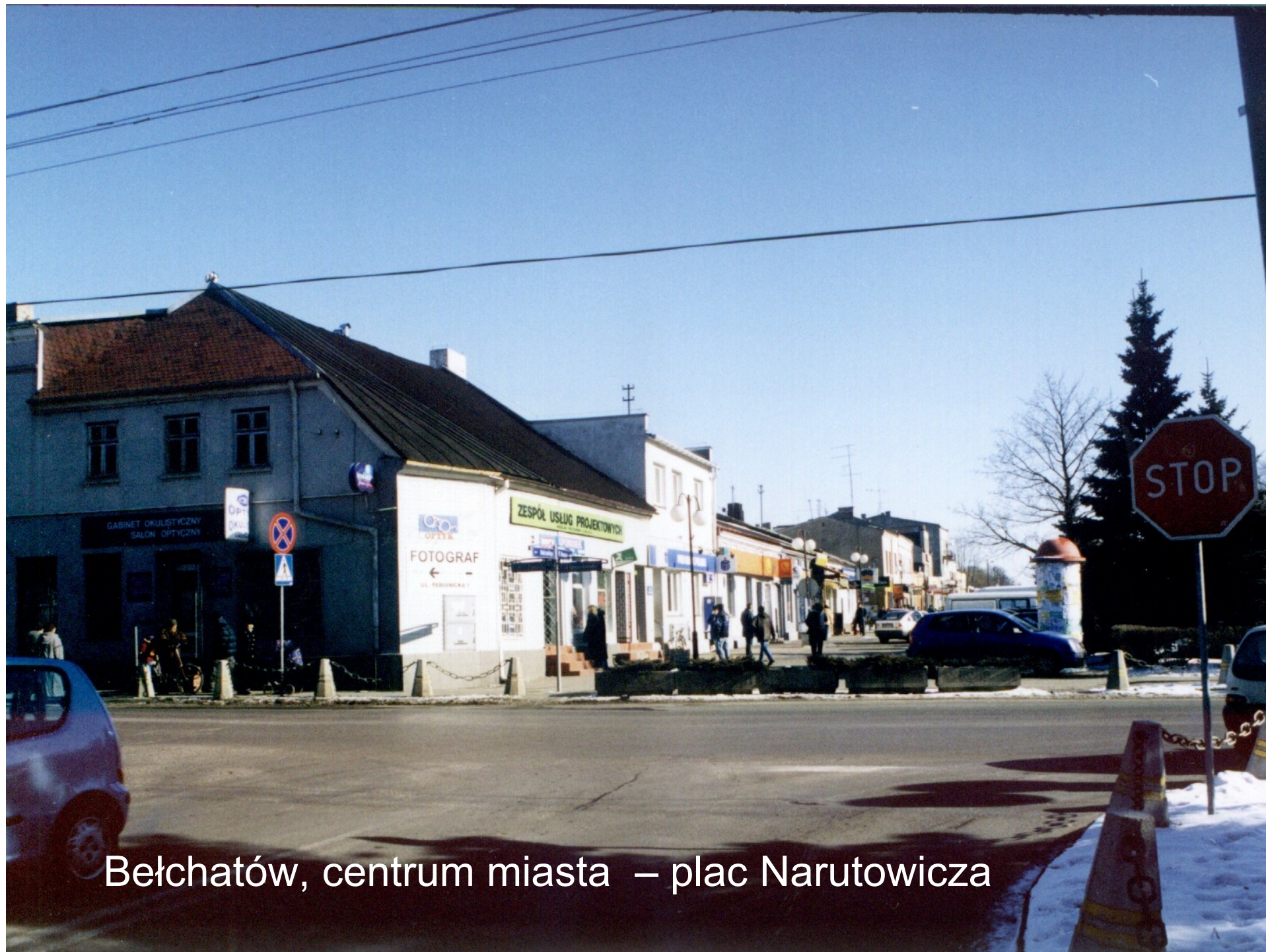
Bełchatów, centrum miasta – plac Narutowicza