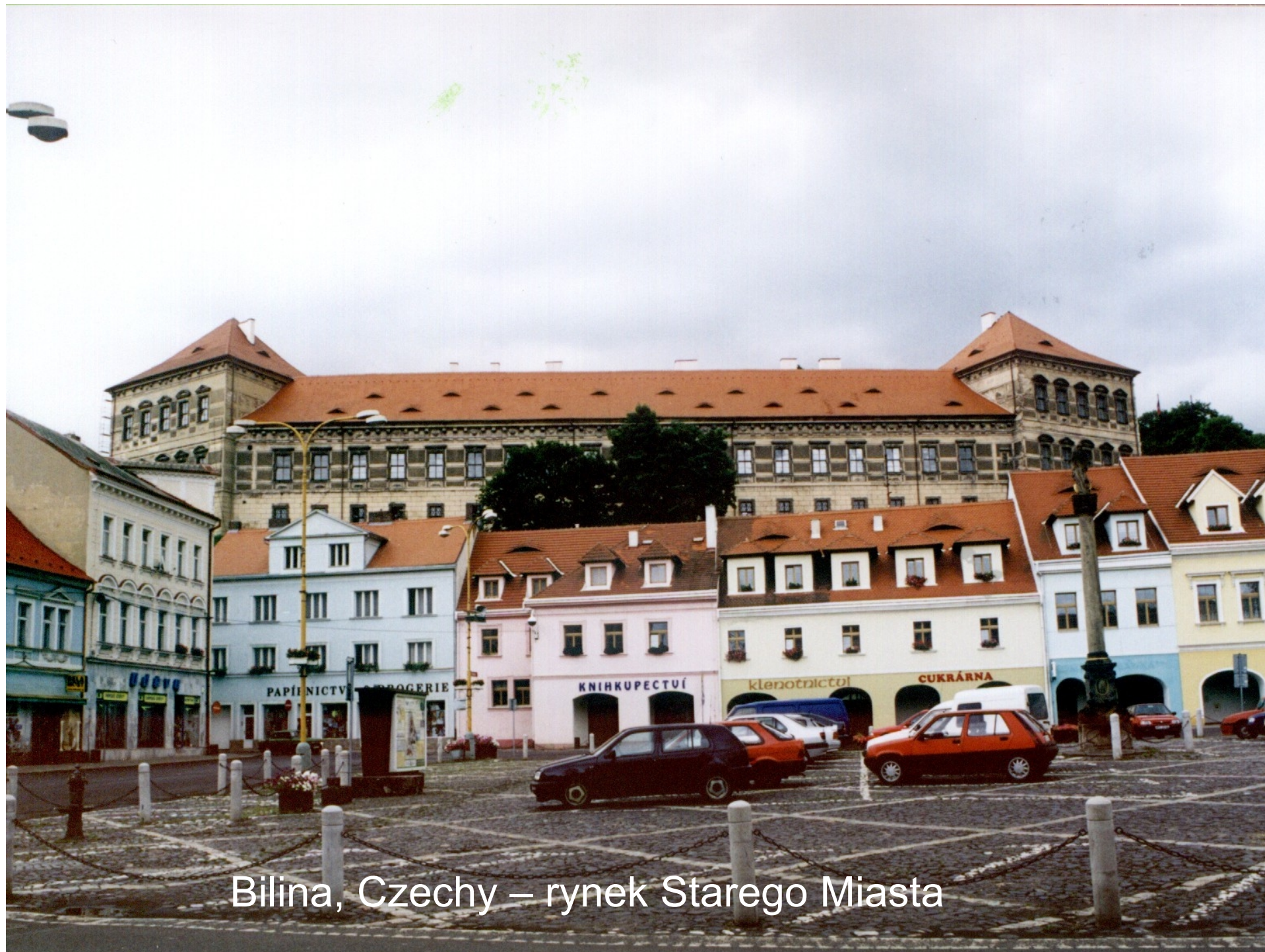
Bilina, Czechy – rynek Starego Miasta